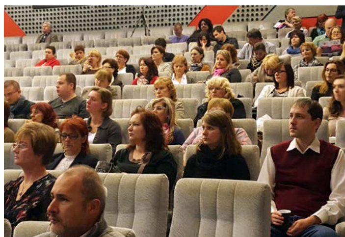
Fotografie zo Záverečnej konferencie CISMA a IS RFO dňa 13.októbra 2015.