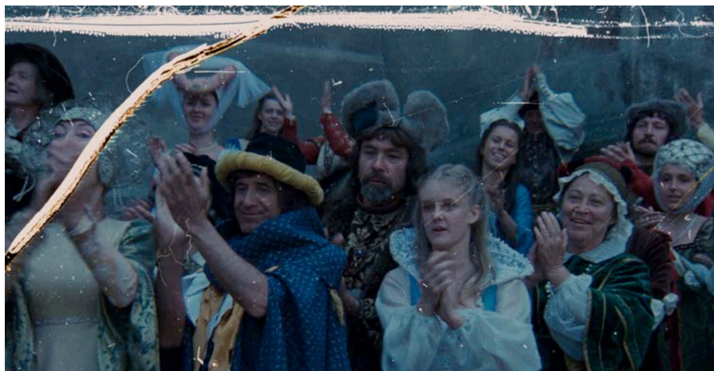
Originálny sken filmového políčka