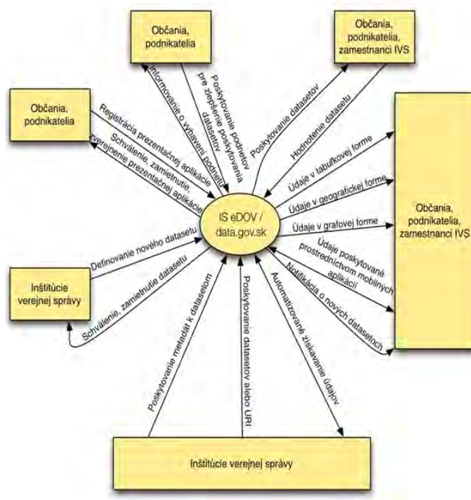
Informačné toky medzi IS eDOV a externými subjektmi, komponent data.gov.sk

rené vládnutie Slovensko prihlásilo, patrí transparentnosť vlády a VS, občianska participácia, zodpovednosť a otvorenosť prostredníctvom nových technológií a podporí tak využívanie nových technológií pri vytváraní inovácií a tiež aktívnu participáciu občanov pri zapájaní sa do verejnej diskusie. Realizáciou projektu sa podporia opatrenia na sprístupnenie informácií týkajúcich sa aktivít vlády a VS, a bude sa riadiť pravidlami, prostredníctvom ktorých sa za tieto aktivity bude zodpovedať.