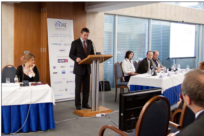
Konferenciu iDEME 2012 otvoril štátny tajomník MF SR Peter Pellegrini, v ktorého gescii je aj informatizácia spoločnosti.