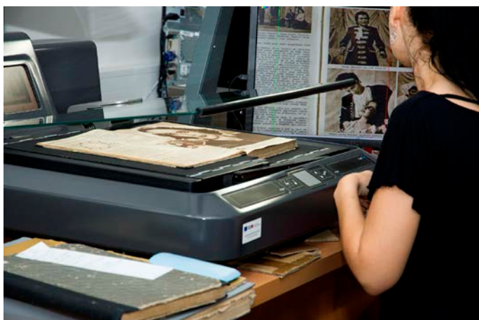
Ručný skener a opatrná manipulácia s dokumentom

Každý dokument sa vydá cestou od roztriedenia, čistenia a zaevidovania v systéme do digitalizačného centra vo Vrútkach. V procese digitalizácie je spolu 22 ťahúňov - manuálnych, poloautomatických a automatických profesionálnych skenerov, kde sa dokumenty rozčlenené podľa formátu a typu väzby skenujú. Spracovanie skenov pokračuje postprocessing-om, ktorý zahŕňa najmä úpravu obrazového súboru, tvorbu metadát, kontrolu kvality a vytvorenie tzv. PSP balíčka. Teda kompletný dokument získa aj svoj „rodný list“. Zaujímavosťou je, že denne je v obeh digitalizácie 3500 objektov. Na projekte pracuje približne 150 ľudí a doteraz sa zdigitalizovalo viac ako milión všetkých objektov.