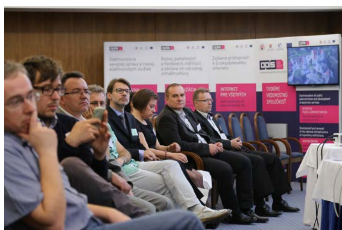
Pohľad na účastníkov konferencie iDEME OPIS 2014.