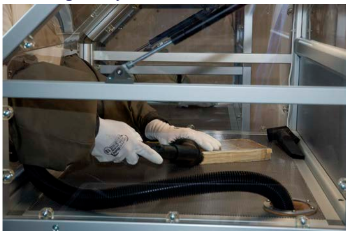
Čistenie dokumentu pred digitalizáciou

Každý dokument sa vydá cestou od roztriedenia, čistenia a zaevidovania v systéme do digitalizačného centra vo Vrútkach. V procese digitalizácie je spolu 22 ťahúňov - manuálnych, poloautomatických a automatických profesionálnych skenerov, kde sa dokumenty rozčlenené podľa formátu a typu väzby skenujú. Spracovanie skenov pokračuje postprocessing-om, ktorý zahŕňa najmä úpravu obrazového súboru, tvorbu metadát, kontrolu kvality a vytvorenie tzv. PSP balíčka. Teda kompletný dokument získa aj svoj „rodný list“. Zaujímavosťou je, že denne je v obeh digitalizácie 3500 objektov. Na projekte pracuje približne 150 ľudí a doteraz sa zdigitalizovalo viac ako milión všetkých objektov.