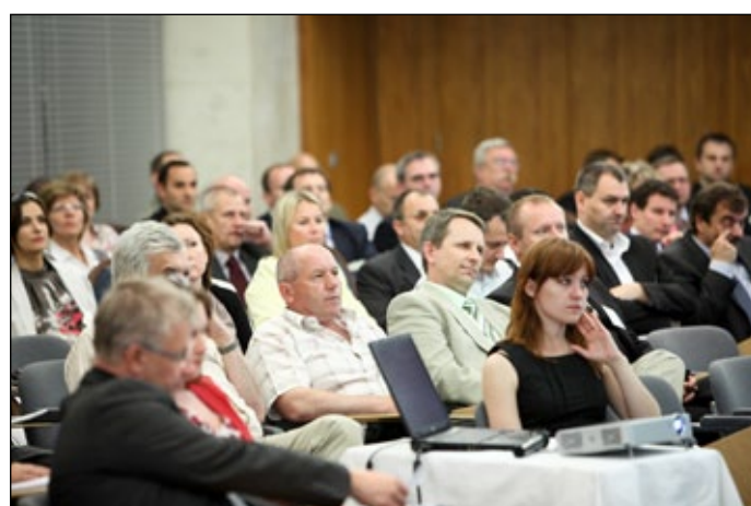
Národnej konferencie OPIS a konferencie ITAPA sa zúčastnilo vyše 100 zúčemcov.