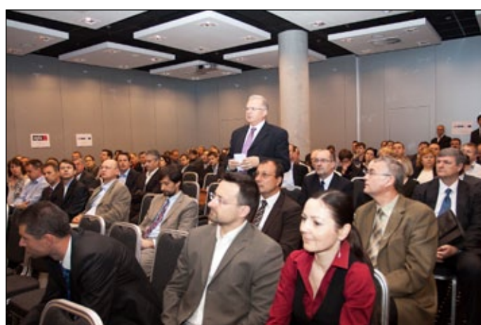
Medzi účastníkmi boli predovšetkým realizátori projektov zo štátnej správy a dodávatelia projektov.

Prezentácie z podujatia si môžete stiahnuť zo stránky: www.informatizacia.sk